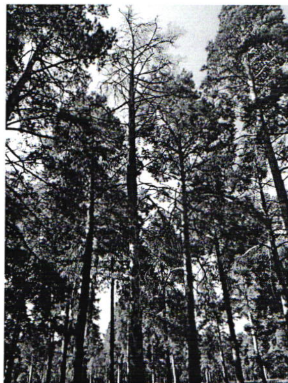
Дерево № 2