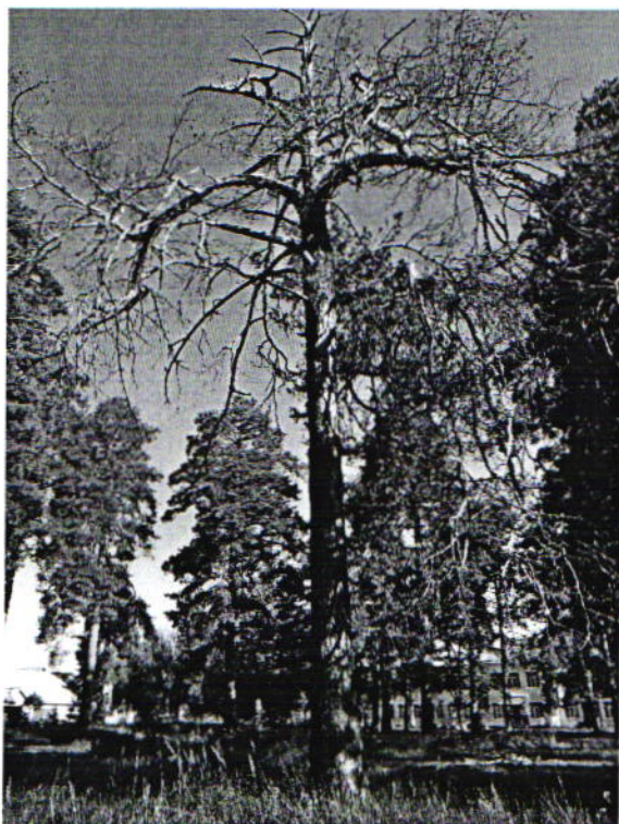
Дерево № 1