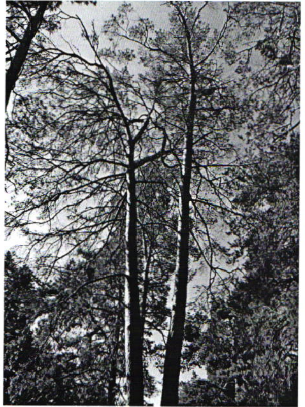
Деревья № 8 и № 9