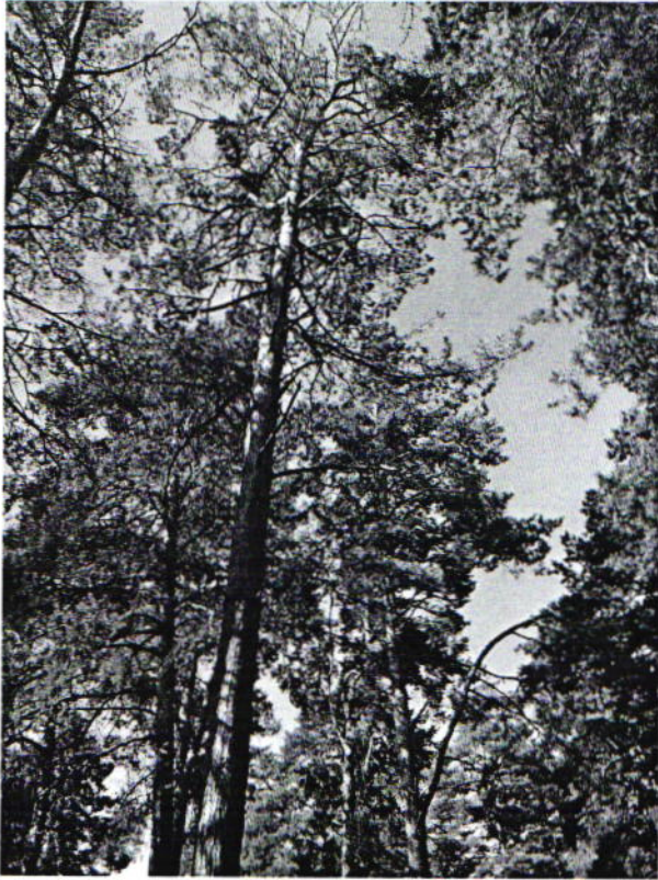
Дерево № 7