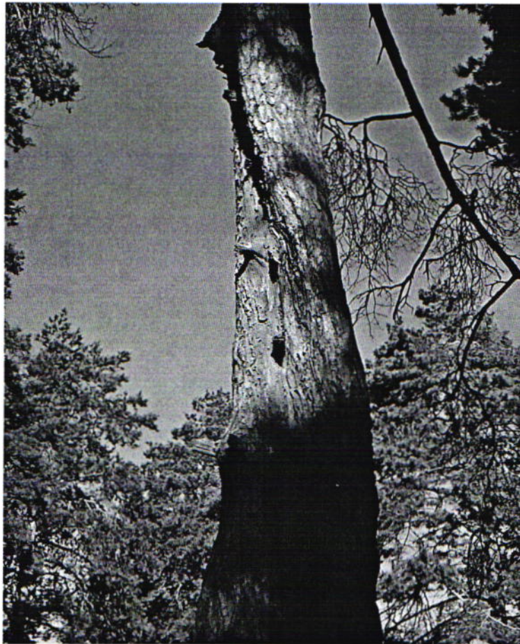
Дерево № 6