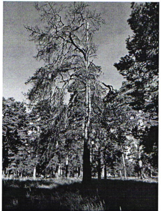
Дерево № 11