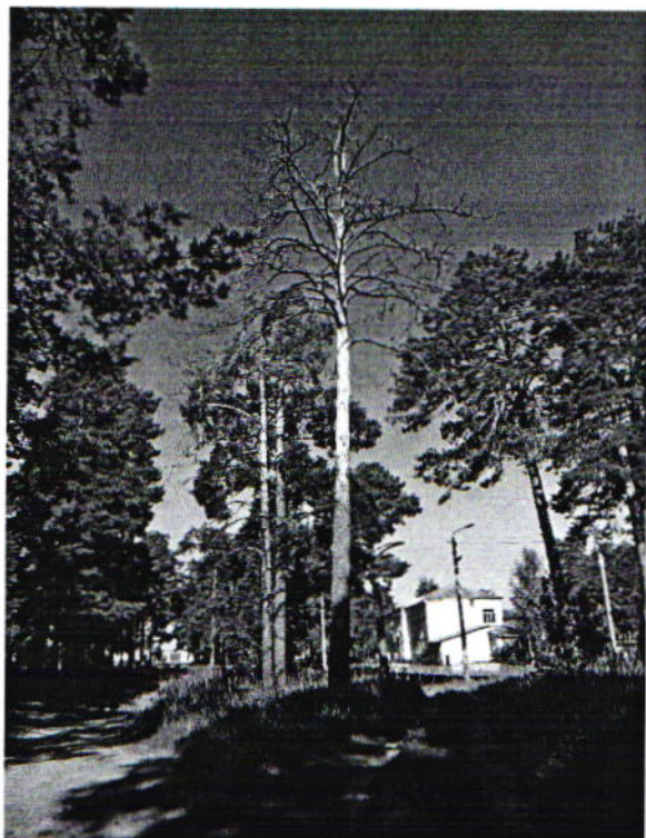
Дерево № 3