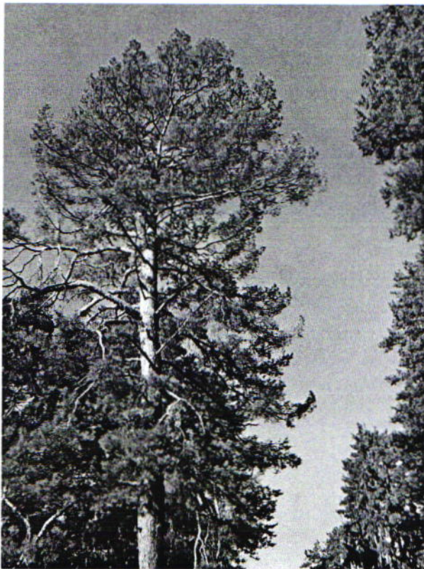
Дерево № 10