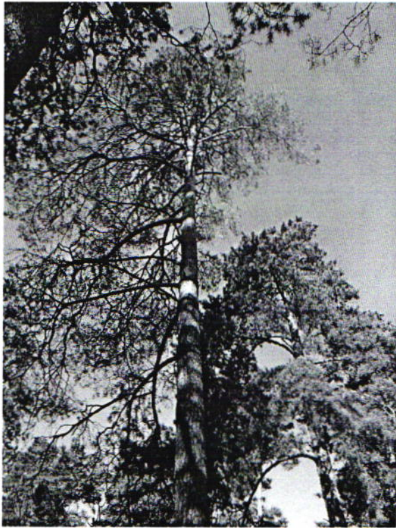
Дерево № 5