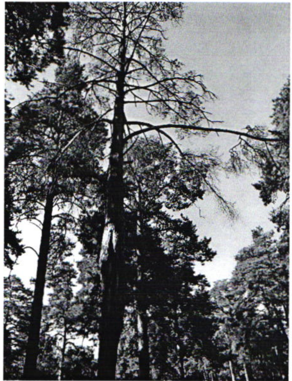
Дерево № 6