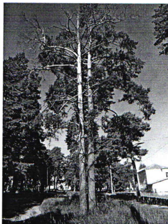
Дерево № 4